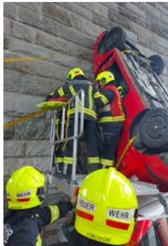
Technische Übung, Juni 2023