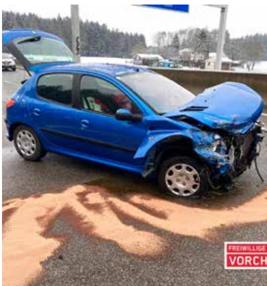
Verkehrsunfall, Jänner 2023