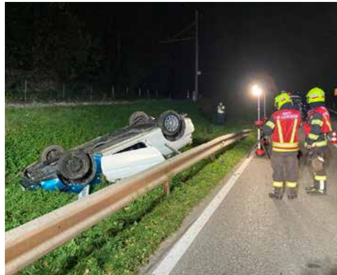
Verkehrsunfall, Oktober 2023