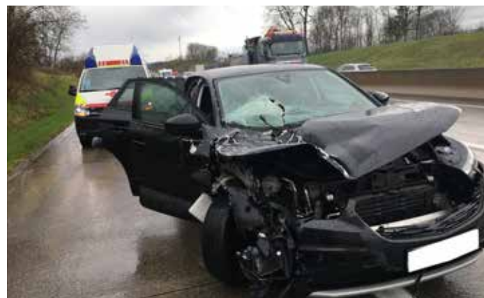
Verkehrsunfall, April 2023