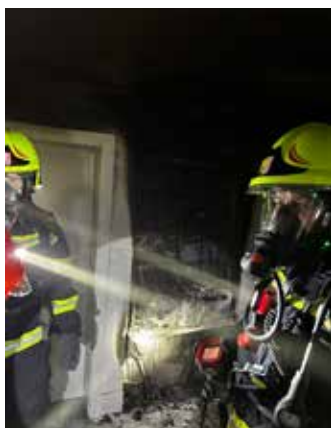
Brand Hausstromverteiler, Mai 2023