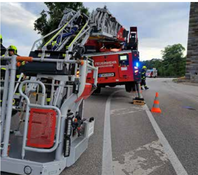
Monatsübung, Juli 2023