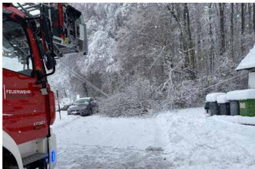
Schneedruck, Dezember 2023