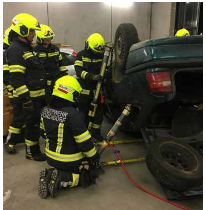
Technische Übung, Februar 2023