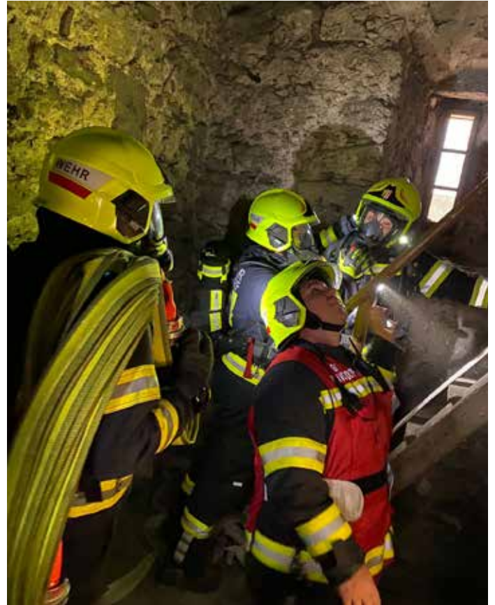
ATS-Übung, Juli 2023