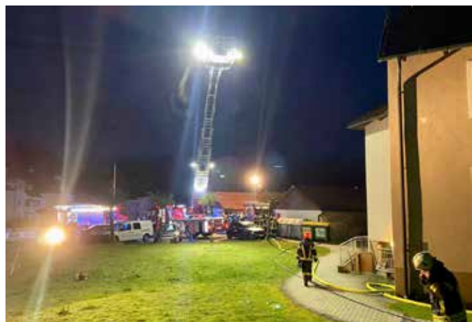
Brand Wohnhaus Kirchham, April 2023