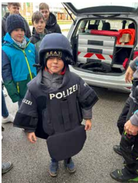
Besuch der Polizei