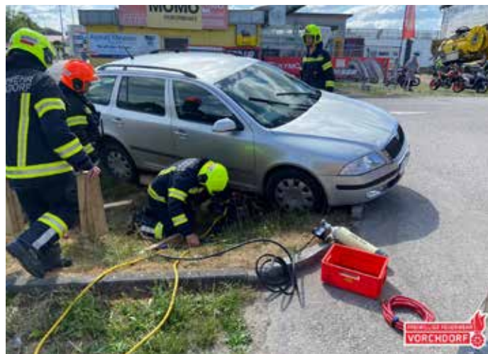
Fahrzeugbergung, Juli 2023