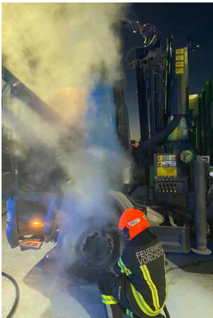
LKW-Brand, September 2023

Bei einem größeren Brand im Hackschnitzellager eines Industriebetriebes waren wir mit unserer Drehleiter und dem Rüstlöschfahrzeug zur Unterstützung der Betriebsfeuerwehr Steyrermühl, im Gemeindegebiet von Laakirchen im Einsatz.