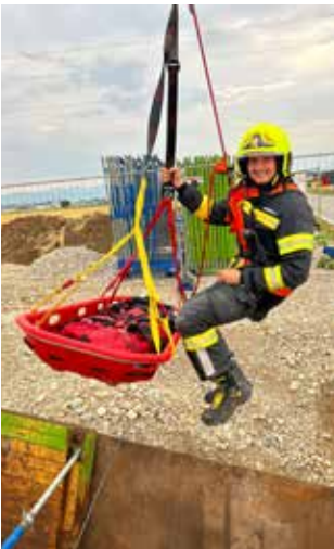
Abseilübung, Juli 2023

Aufgrund unserer Pflichtbereichsklasse sind uns 20 Übungen und 4 Schulungen pro Jahr vorgeschrieben, im Jahr 2023 konnten wir, wie auch die Jahre zuvor, durch Monats-, Themen-, Maschinisten-, Atemschutz- und Drehleiterübungen sowie zahlreicher Winterschulungen den Ausbildungsstand unserer Mannschaft wieder sehr hochhalten.