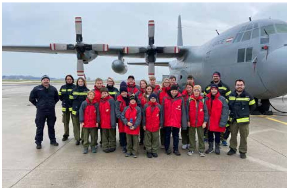
Besuch des Fliegerhorst