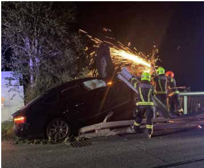
Fahrzeugbergung, September 2023